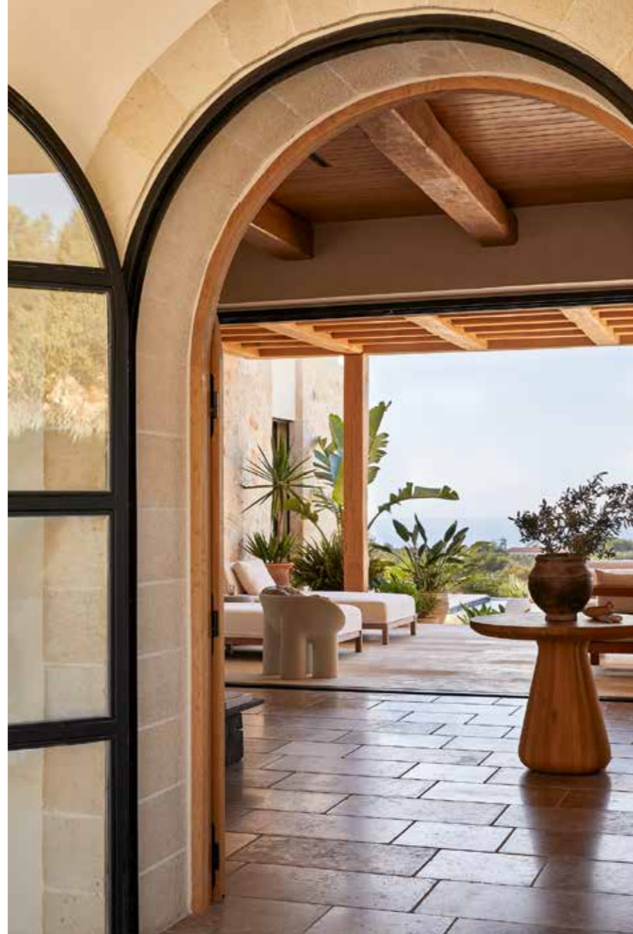
Головна вітальня на відкритому просторі: вуличні меблі, Cari Giannoulas/Furniture Gallery та Nino Tailor Made; люстра, Honoré; торшери, Gloster Furniture; настільні лампи, Plus; пуфи, Janus Et Cie.

К ері Джаннуліас відома своїми стриманими й водночас вишуканими інтер'єрами. Шляхом сміливого поєднання люксових і звичайних речей Кері створює оригінальні композиції з акордами благородного гламуру. Завзята мандрівниця, вона виплекала власний стиль життя, власну естетику — своєрідний мікс історичних періодів, масштабів, текстур, місцевого колориту, нового та стародавнього.