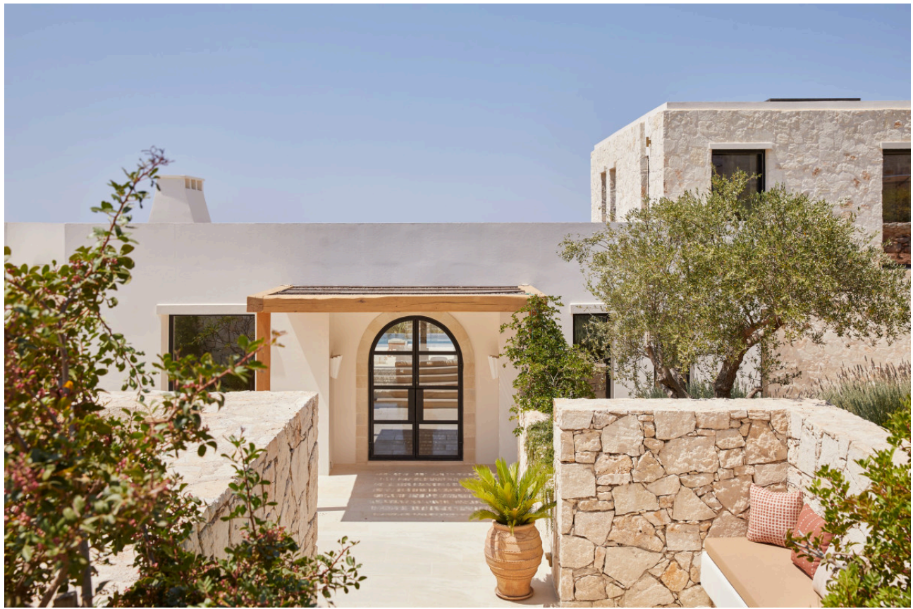
Zdjęcie: Helen Cathcart