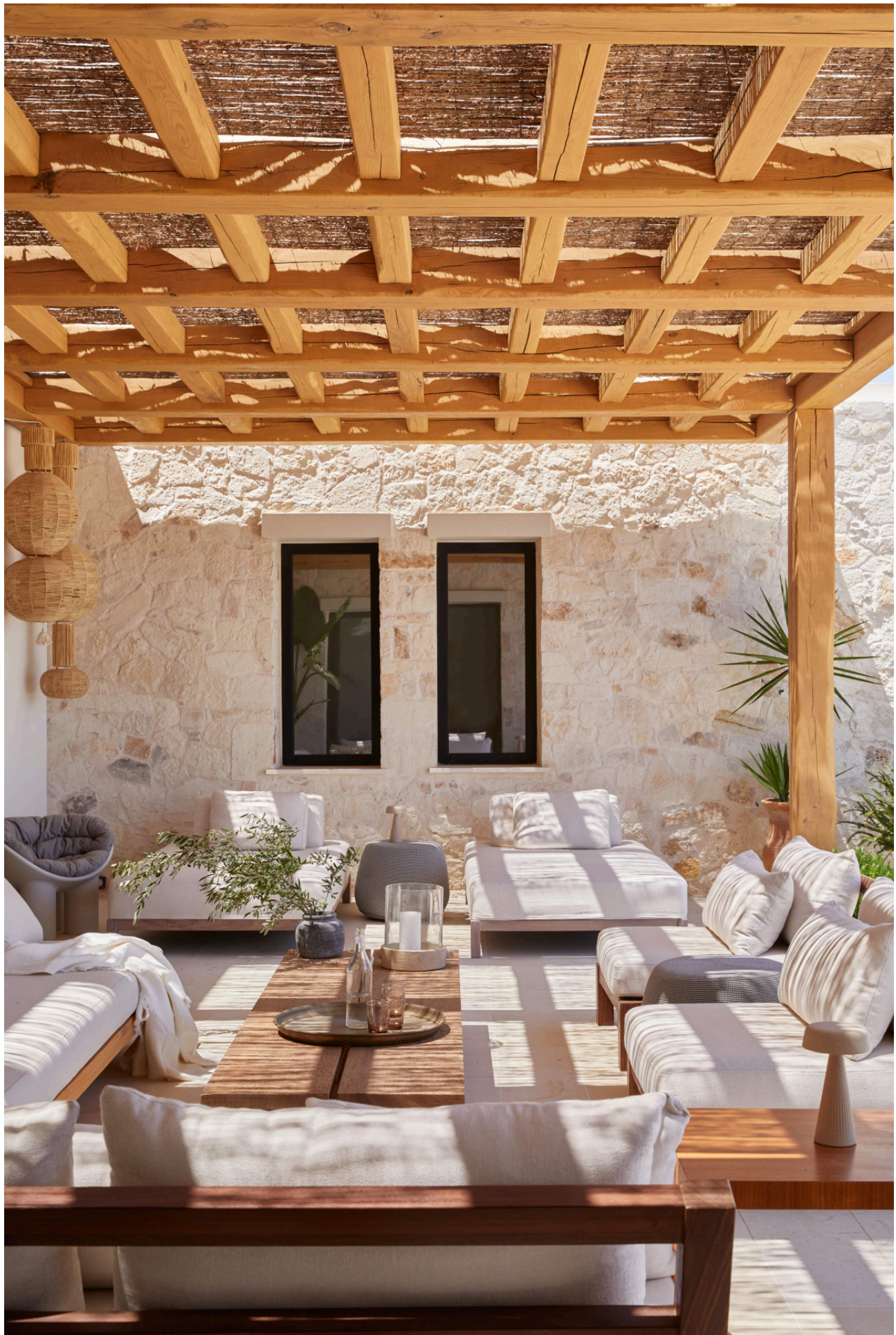
Zdjęcie: Helen Cathcart